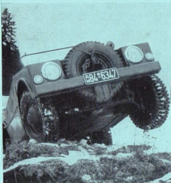
Schnoppschüsse von Demonstrationen auf schwierigstem Gelände

Neben der ausgezeichneten Geländegängigkeit gehören die bekannten Vorzüge der Luftkühlung sowie aussergewöhnliche Schnelligkeit und Wendigkeit, grosse Tragkraft bei geringem Gewicht, hohe Betriebssicherheit, einfache Wartung und bescheidener Verbrauch zu den markantesten Merkmalen des Porsche 597. Seine Wirtschaftlichkeit und absolute Pannensicherheit haben sich besonders deutlich anlässlich einer Versuchsfahrt in der Wüste über mehrere tausend Kilometer gezeigt.